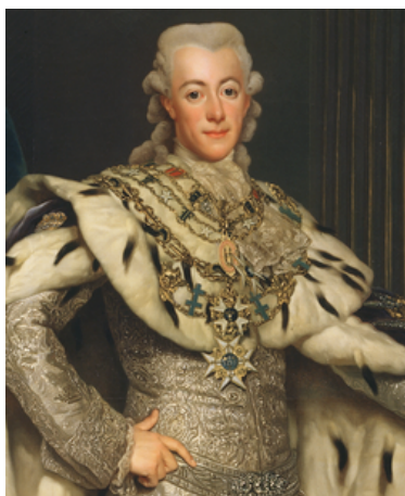
Gustav III regent 1771-1792 i kröningsdräkt